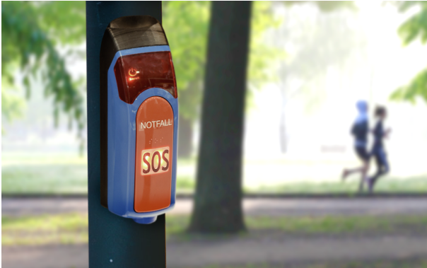
Sicherheit und schnelle Hilfe für öffentliche Plätze