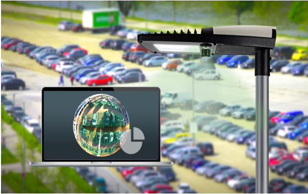
1 LED-Leuchte mit integrierten Kameras zur Erfassung von Parkflächen